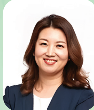
주제강연 성진야 사회성·감성교육연구소